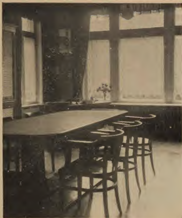
Bureau des Israelitischen humanitären Frauenvereins.